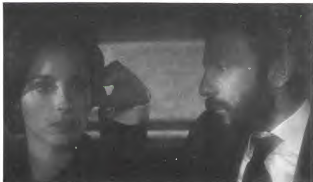
Amparo Muñoz – Jose Luis Gomez